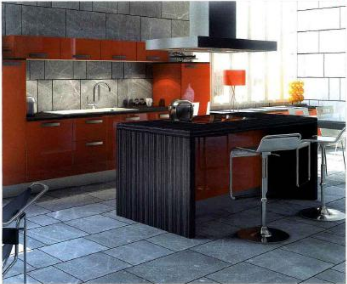
Modum, design en ligne (Photo ci-dessus)

Cette composition en ligne permet de révéler toute l'originalité des dimensions des meubles hauts. Résolument plats, ils forment ainsi un cadre tout autour du point d'eau et délimitent naturellement la cri-